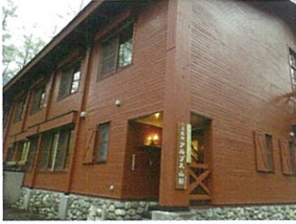
アルプス山荘外観

公益社団法人日本山岳ガイド協会が運営する上高地の研修施設「アルプス山荘」を活用し、山岳ガイド、登山ガイド、自然ガイドが研修を行っているその内容を一般向けにした研修内容の講座として開設します。これは、登山、自然に対する理解を深め、山岳遭難事故の防止、自然環境の保全を図るための活動の一環です。講座は、登山初心者の方も、経験豊富な方も参加できるように、馴染みやすいテーマを取り上げた「公開講座」といたしました。連続した講座は、個別に参加してもそれだけで独立した講座となっているため、受講可能です。