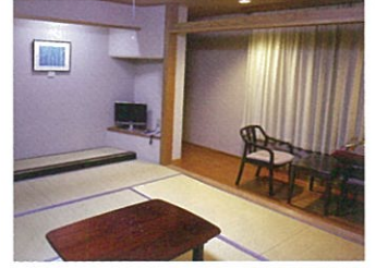
アルプス山荘客室

公益社団法人日本山岳ガイド協会が運営する上高地の研修施設「アルプス山荘」を活用し、山岳ガイド、登山ガイド、自然ガイドが研修を行っているその内容を一般向けにした研修内容の講座として開設します。これは、登山、自然に対する理解を深め、山岳遭難事故の防止、自然環境の保全を図るための活動の一環です。講座は、登山初心者の方も、経験豊富な方も参加できるように、馴染みやすいテーマを取り上げた「公開講座」といたしました。連続した講座は、個別に参加してもそれだけで独立した講座となっているため、受講可能です。